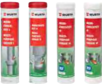
Многоцелевая смазка I, II, III, IV Арт. 0893 . 870 . 1 Арт. 0893 . 871 . 1 Арт. 0890 . 402 Арт. 0890 . 107 . 003