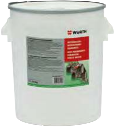
Смазка для тяжелого транспорта Арт. 0893 . 880 . 4