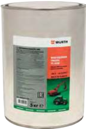
Многоцелевая пластиковая смазка EP2 TP/AGRI Арт. 0893 . 874 . 105 Арт. 0893 . 874 . 1