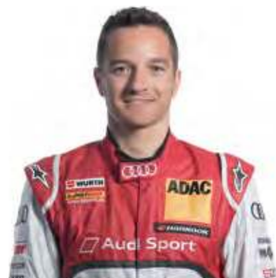
Тимо Шейдер Чемпион DTM

Сегодня моторное масло является неотъемлемым конструктивным элементом двигателя, который для легкового автомобиля может стоить от 8 000 до 15 000 евро. Попытка сэкономить в неправильном месте может стать дорогостоящей, поэтому вы должны полагаться на высокоэффективное масло, например, на то, которым мы пользуемся в чемпионате DTM (German Touring Car Masters). TRIATHLON® от Würth производится в Германии в соответствии с DIN EN ISO 9001 и идеально подходит для вашего двигателя и автомобиля, чтобы обеспечить комфортное вождение автомобиля.